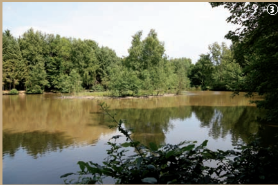
Étang du Flaquet

Que diriez-vous d'une petite promenade dans les bois, ou plutôt en forêt ?