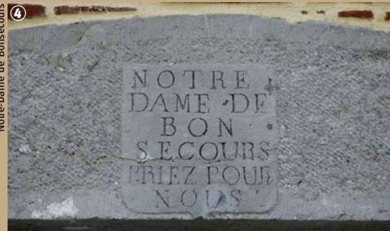
Notre-Dame de Bonsecours

De nos jours, les forêts domaniales du Nord, pour la plupart anciennes forêts royales et ecclésiastiques, sont soumises au régime forestier et ont comme fonction principale la production de bois d'œuvre. Cependant, ce qui attire le plus de monde dans les bois, c'est le côté récréatif du lieu, l'environnement vert des citadins les incite à venir se ressourcer au cœur même de la nature ! Ainsi, la forêt s'est dotée d'un nouveau rôle : la découverte de la richesse et de la diversité floristique et faunistique, pour que tout un chacun puisse, en se baladant, se sentir en harmonie avec Dame Nature !