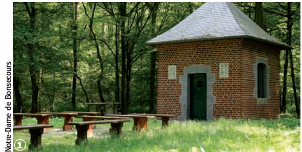
Notre-Dame de Bonsecours

(6,5 km ou 10 km - 1 h 30 à 2 h 00 ou 2 h 30 à 3 h 20)